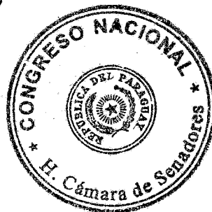
Fernando Lugo Méndez Presidente H. Cámara de Senadores